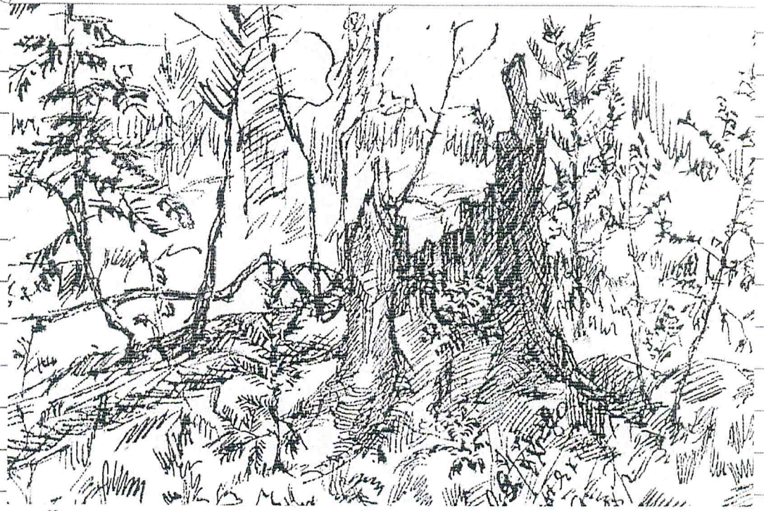
Фото - копия зарисовки автора работы.