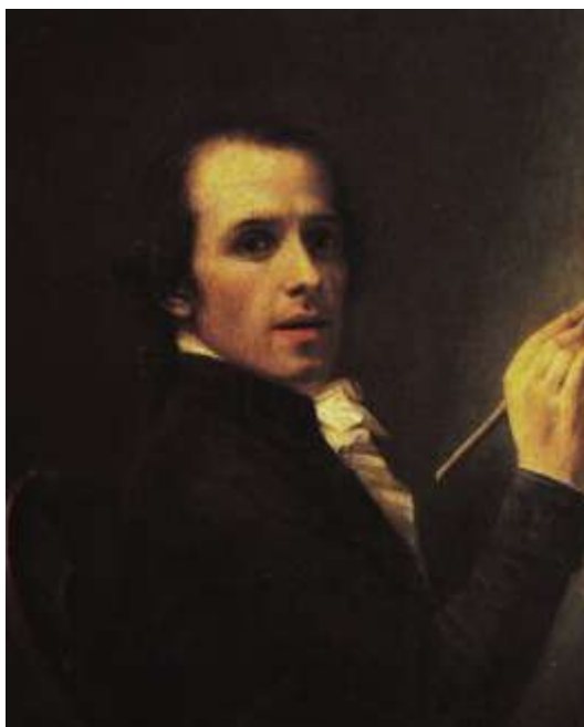
Антонио Канова. Автопортрет (1792)