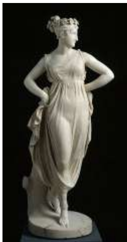
Антонио Канова. Танцовщица (1816), Эрмитаж

Анализируя пластическую форму, напишите,